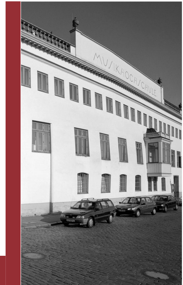
© 2008 www.o2id.de © Fotos: Ralf Buscher, Hamburg

Eine gemeinsame Veranstaltung der Gemeinnützigen, der Overbeck-Gesellschaft, Verein von Kunstfreunden e.V., und des ArchitekturForumLübeck e.V.