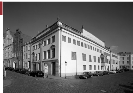
Große Petersgrube - Obertrave: Musikhochschule, Lübeck

13.30 Uhr Führung durch die Musikhochschule Große Petersgrube, 23552 Lübeck Peter Rix, Architekt BDA